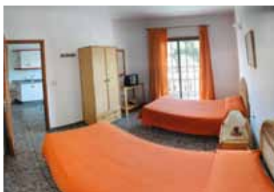
Bildgalerie mit vielen Bildern von Hotel, Essen etc. online unter www.bici-budget.ch/bildgalerie

Ihr Hotel Anlage mit 22 Appartements verteilt auf 3 Etagen. Hübsche, familiär geführte Appartement-Anlage mit gepflegtem Garten, Swimmingpool mit Sonnenterrasse, Liegen und Schirmen. Empfangsbereich mit Reception, Sitzecke und Internetcafé (gegen Gebühr). Cafeteria, kleiner Supermarkt und Fahrräder (gegen Gebühr). Ideal für individuelle Ferien auf La Palma.